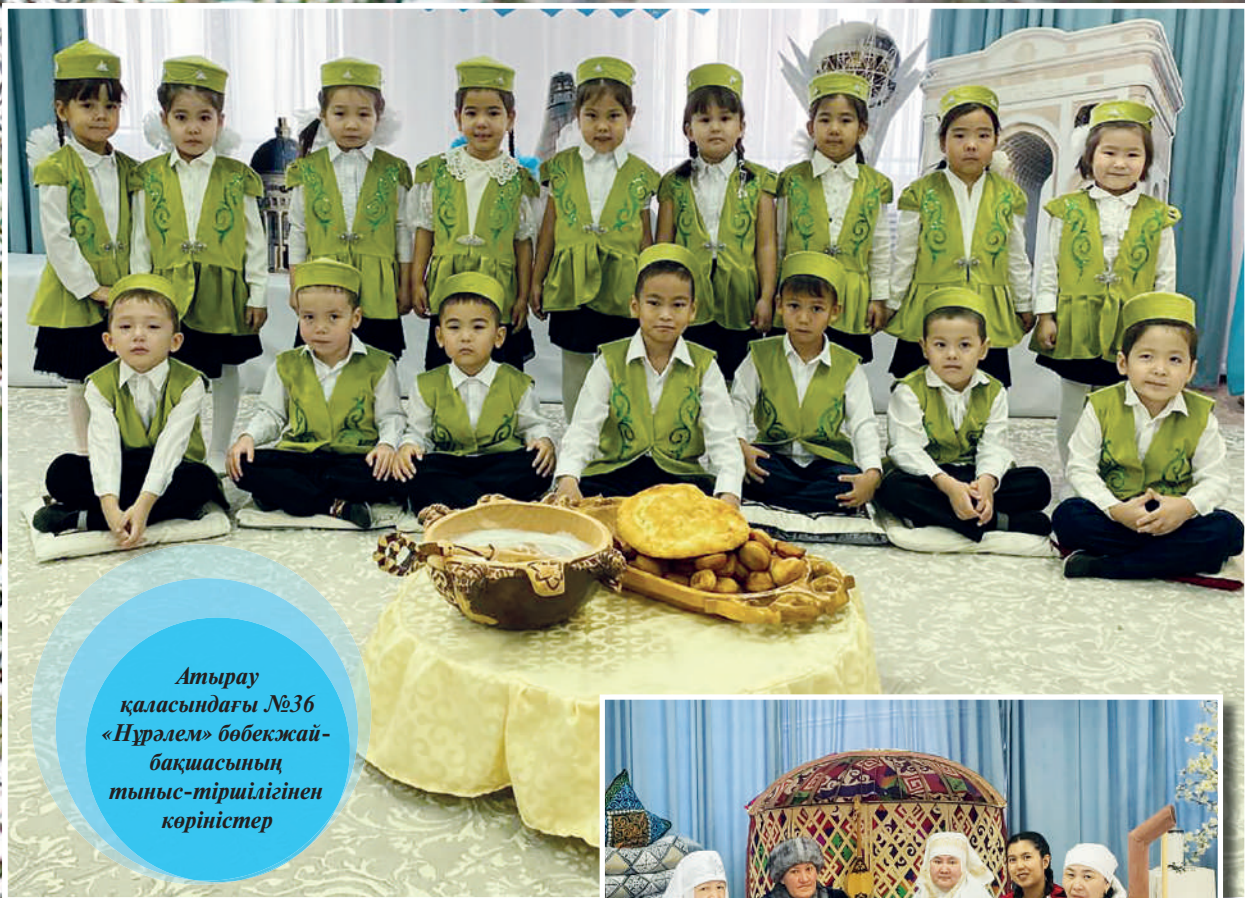
Атырау қаласындағы №36 «Нұрәлем» бөбекжай-бақшасының тыныс-тіршілігінен көріністер